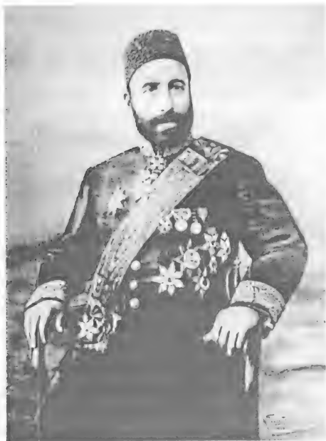
Гаджи Зейнал-Абдин Тагиев (ок.1838 – 1924)

в Камеральных описаниях 1849, 1860 и 1873/74 гг., можно заметить, что данные Камеральных описаний 1849 и 1860 гг. являются более точными, чем Камерального описания 1873/74 г.